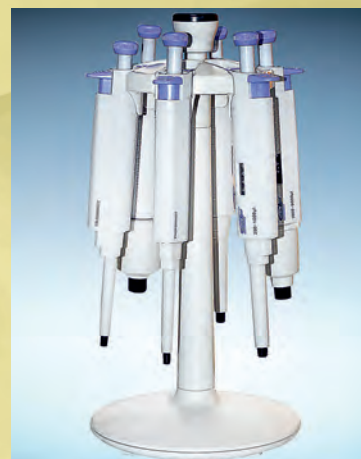
STATYW KARUZELOWY NA 6 PIPET - okrągły Statyw zaprojektowany na 6 jedno i/lub wielokanałowych Nr katalogowy 30-71848 cena 150,00